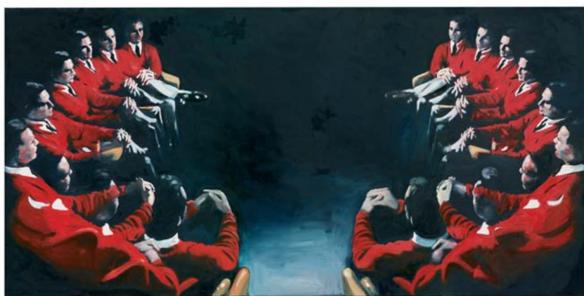
„TALK TOGETHER“ (ÖL AUF LEINWAND 2007, 120 X 240 CM)