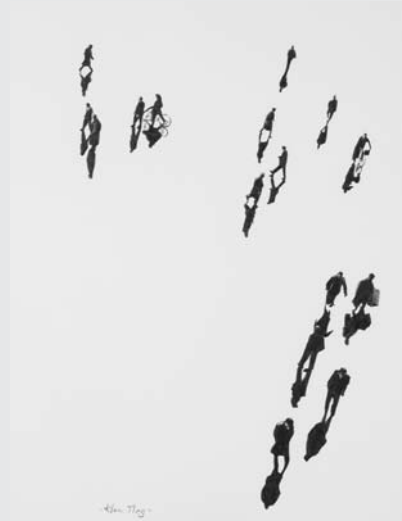
„KLEINE MENGE“ (BLEISTIFT AUF PAPIER 2008, 60 x 80 CM)

DIE WELT IST (NICHT NUR) SCHWARZ-WEISS: BLEISTIFTARBEITEN