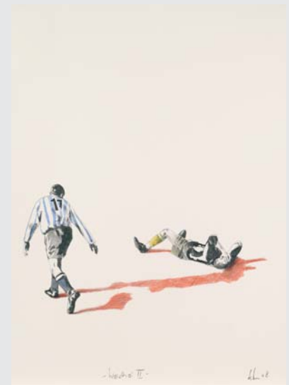
„WEICHEI II“ (BLEISTIFT AUF PAPIER 2008, 65 x 80 CM)