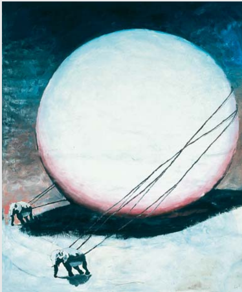
„GROSSES BEWEGEN“ (ÖL AUF LEINWAND 2004, 160 X 190 CM)