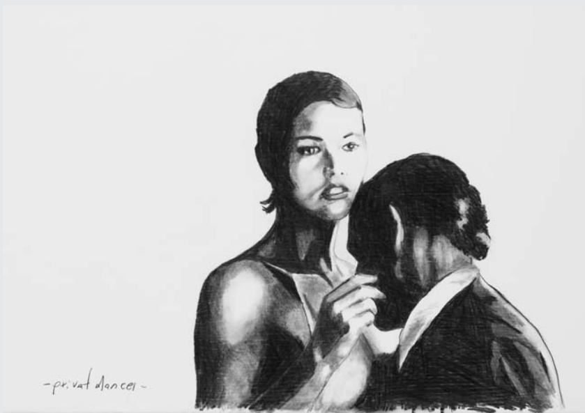
„PRIVAT DANCER“ (BLEISTIFT AUF PAPIER 2008, 60 x 80 CM)