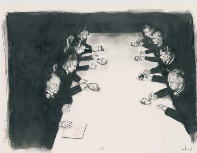
„LABOR“ (BLEISTIFT AUF PAPIER 2008, 65 x 80 CM)