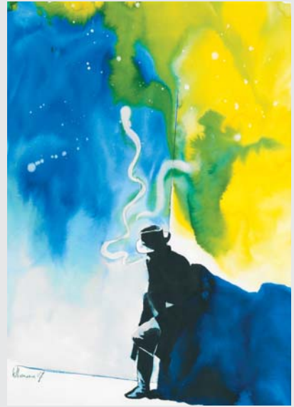
„RAUCHER“ (AQUARELL 2008, 60 X 80 CM)