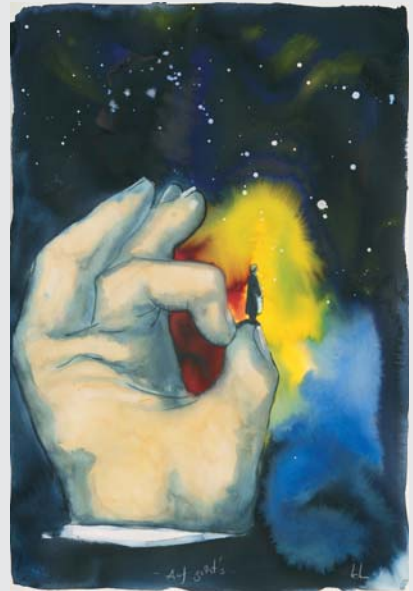
„AUF GEHT'S“ (AQUARELL 2008, 60 X 80 CM)