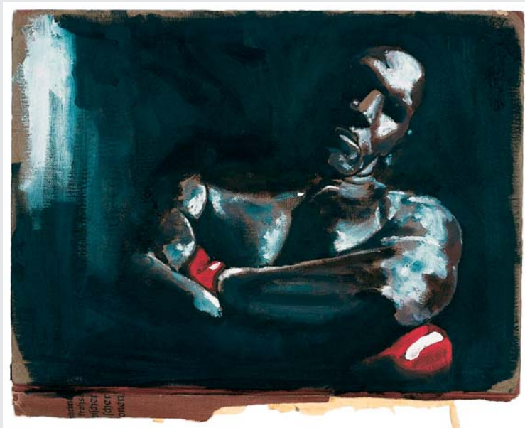
„WER HAT ANGST VORM SCHWARZEN MANN“ (ÖL AUF BUCHDECKEL 2007, 30 X 45 CM)