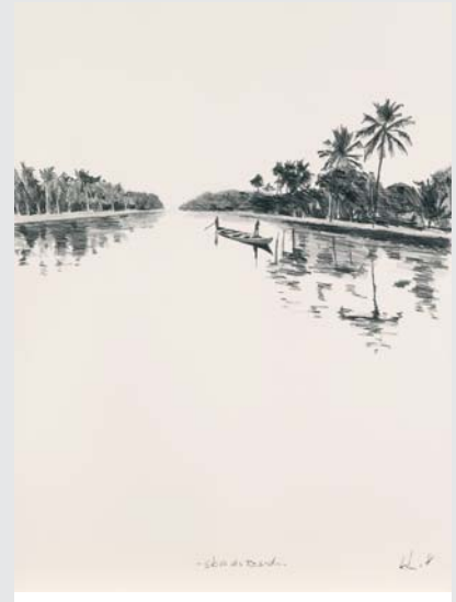
„SKIZZE DES REISENDEN“ (BLEISTIFT AUF PAPIER 2008, 65 x 80 CM)